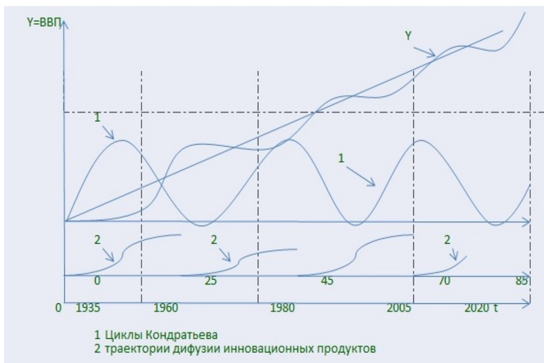
Рисунок 1. Графическая схема траектории движения общего выпуска (ВВП).

ИЦ упорядочились в ходе человеческой истории. Прежде всего, их продолжительность с нескольких десятков тысяч лет сократилась до нескольких десятков лет к концу XX века. Второе, меняются характер и степень охвата ИЦ - от дискретного к непрерывному, от локального к общему и глобальному. Третье- смена форм внедрения их результатов, методов посредничества государства в этом процессе: со сменой организаторской роли государства его регулируемыми функциями. Пример Финляндии ясно свидетельствует о том, что именно правительства играют лидирующую роль в развитии высоких технологий, поощряя их внедрение и использование частным бизнесом. Результат ИЦ - переход к новой технико-технологической системе организации общественного производства. По сути этот процесс имеет такой временной график: наука => научно-технический результат => нововведение (продукт инновации) => производство => воспроизводство. "Нововведение" (безусловно научный результат), еще не представляет потребительского интереса. Круг его потенциальных потребителей - это те, кто занят научно-технической (технологической) разработкой данного нововведения. Если общий экономический эффект есть производство количества потребления, приходящееся на одного потребителя, на количество потребителей, то поставленные выше стрелки можно заменить математическими знаками "<".