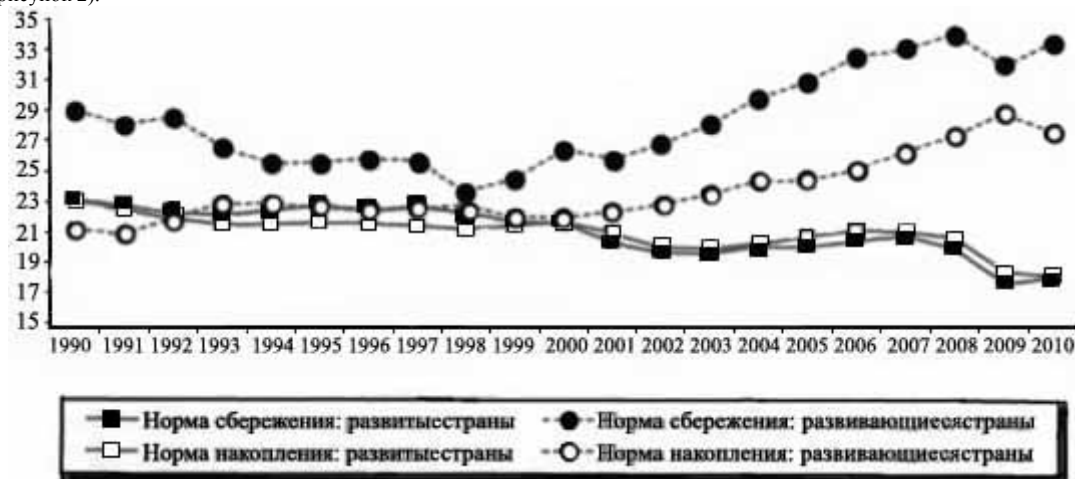
Рисунок 2 -

Таким образом, основной причиной глобальных дисбалансов выступает дифференциация нормы накопления в различных группах стран мировой экономики. С 2000-х гг. формируется тенденция роста нормы накопления в развивающихся и ее падения в развитых странах (рисунок 2).