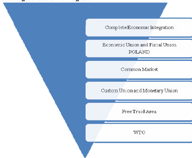
Figure 1: Stages of economic integration

As a result, national economies are merged with each other. It leads the internationalization of economic life, and it intertwines many and different phases of scientific, technical, industrial, investment, financial and commercial activities. Economic interdependence of countries and people becomes palpable. Comprehensive global economic regional ties have been gradually becoming particularly closer, covering many countries. International economic integration finds practical expression and identifying prospects of further economic progress.