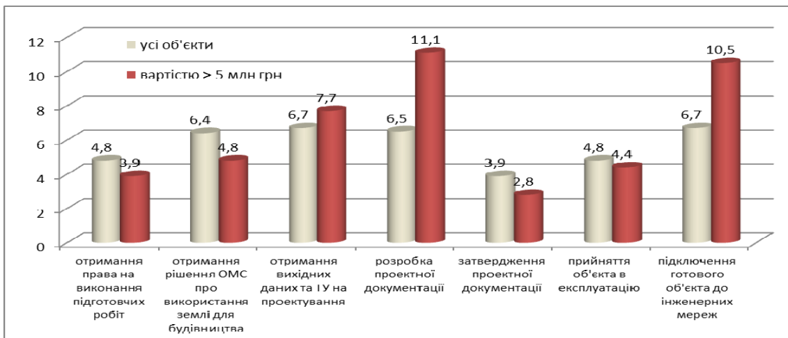
Рис. 2. Середня кількість візитів для отримання документації, 2012 р. (Складено за: [10, с.10-11])

Протягом останніх років зросла кількість суб'єктів господарювання, які користувалися послугами Центрів надання адмінпослуг (ЦНАП) – 62% опитаних скористались послугами в 2012 р. та вважають, що вони зможуть знизити рівень корупції (79% опитаних).