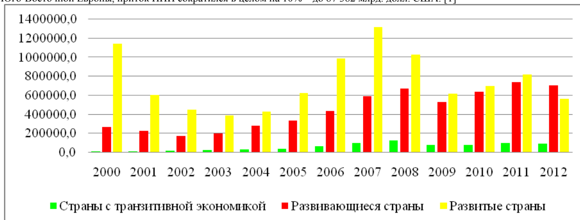
Рис. 1. Потоки ПИИ в трех группах стран, 2000-2012 гг. (млн. долл. США) [4]

упали на 32% – до 560 718 млн. долл. США, в том числе в странах Европейского союза на 42% – до 258 514 млн. долл. США. Главной причиной сокращения ПИИ явилась неопределенность, вызванная продолжающимся кризисом в еврозоне и политической нестабильностью в ряде стран. В этих условиях многие транснациональные компании (ТНК) предпочли зарубежным инвестициям временную стратегию накопления и консолидации своих авуаров. В развивающихся странах приток ПИИ уменьшился в 2012 году в целом всего на 4% – до 702 825 млн. долл. США. Примечательно, что в прошлом году эта группа стран вышла в лидеры по привлечению иностранного капитала и впервые опередила по совокупному притоку ПИИ развитые государства. При этом в Африке наблюдался даже некоторый рост притока ПИИ, тогда как в развивающихся странах Азии имело место сокращение на 7% – до 407 млрд. долл. США, в том числе в Китае – на 3% – до 121 млрд. долл. США. В группе стран с транзитивной экономикой, куда статистика ООН включает Украину и другие страны СНГ, а также страны Юго-Восточной Европы, приток ПИИ сократился в целом на 10% – до 87 382 млрд. долл. США. [1]