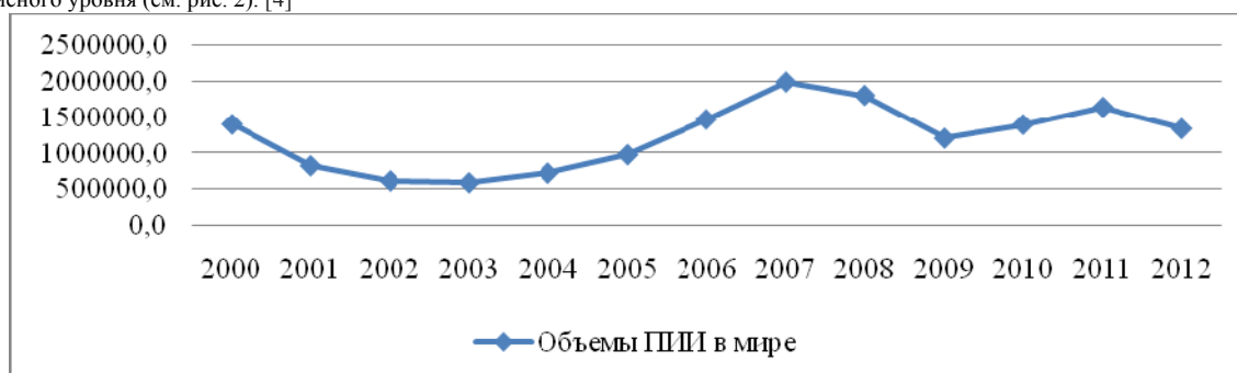
Рис. 2. Объемы ПИИ в мире, 2000-2012 гг. (млн. долл. США) [4]

Однако, если говорить о притоке ПИИ в мире, то нужно отметить, что общий объем ПИИ также значительно сократился. Таким образом, еще в 2011г. объемы притока ПИИ составили 1 651 510,9 млн. долл. США, а уже в 2012 году сократились до 1 350 925,7 млн. долл. США. Таким образом, падение составило 18% и в полтора раза ниже предкризисного уровня 2007г. Это существенный показатель. Кроме того, если в период с 2000 г. потоки ПИИ имели тенденцию к росту, пик которого пришелся на 2007 г. и составили 2 002 694,6 млн. долл. США, то уже в последующие годы наметилась тенденция к снижению. Причем рост ПИИ, который был в 2011 году так и не смог достичь докризисного уровня (см. рис. 2). [4]