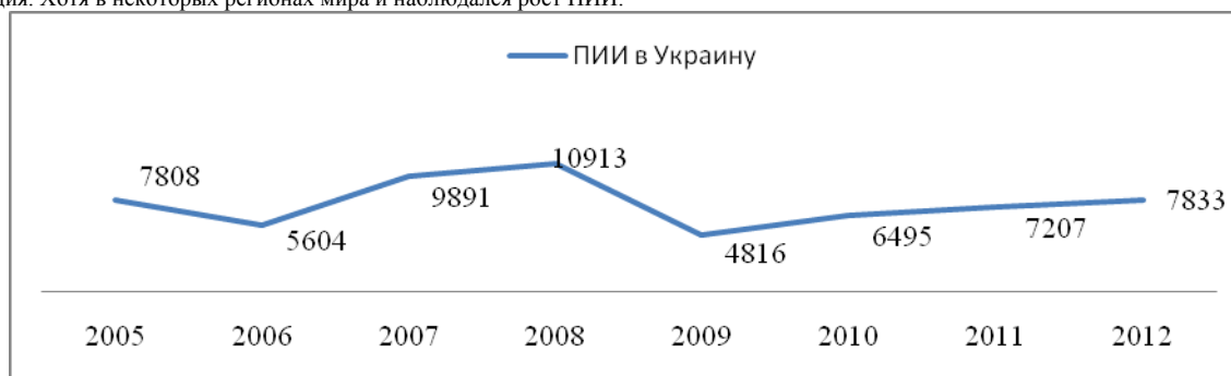
Рис. 3. Приток ПИИ в Украину, 2005-2012 г. (млн. долл. США) [5]

Теперь о главном, о притоке ПИИ в Украину. Если взять период 2005-2012 г., то мы видим, что тенденция прослеживается такая же, как и во всем мире. Пик инвестиционной привлекательности приходится на 2007, 2008 гг. – 9 891 млн. долл. США и 10 913 млн. долл. США, соответственно. Это на 76,5% и 10,3% больше по отношению к предыдущим годам. Однако резкое падение в 2009 г. на 55,9% привело к тому, что и в последующие года объемы притока инвестиций так и не достигли уровня 2007-2008гг. (см. рис. 3) Однако это общая мировая тенденция. Хотя в некоторых регионах мира и наблюдался рост ПИИ.