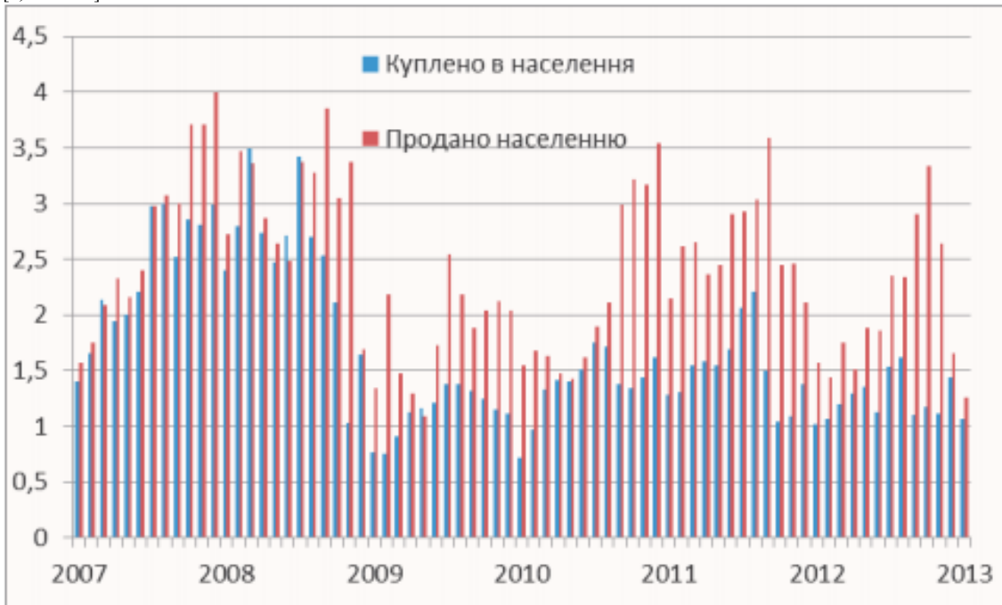
Рис. 1. Попит та пропозиція іноземної валюти на готівковому ринку в Україні у 2007-2013 рр. (місячні дані), млрд. дол. США [9]

З метою врівноваження попиту/пропозиції іноземної валюти на міжбанківському ринку Національний банк України здійснював операції як з продажу, так і в купівлі іноземної валюти. Основною метою операцій було запобігання різким ситуативним курсовим коливанням гривні, збереження її прогнозованої динаміки для забезпечення виконання інфляційних орієнтирів, поповнення і диверсифікація міжнародних резервів. Частка операцій Національного банку в загальному обсязі міжбанківського валютного ринку в 2012 році була значно меншою (3,1%), ніж у 2011 році (6,9%). У цілому в 2012 році сальдо валютних інтервенцій Національного банку України було від'ємним і становило 7,5 млрд. дол. США (в еквіваленті), урахуваючи пряму та опосередковану підтримку енергетичної безпеки держави [7, с. 11–12].