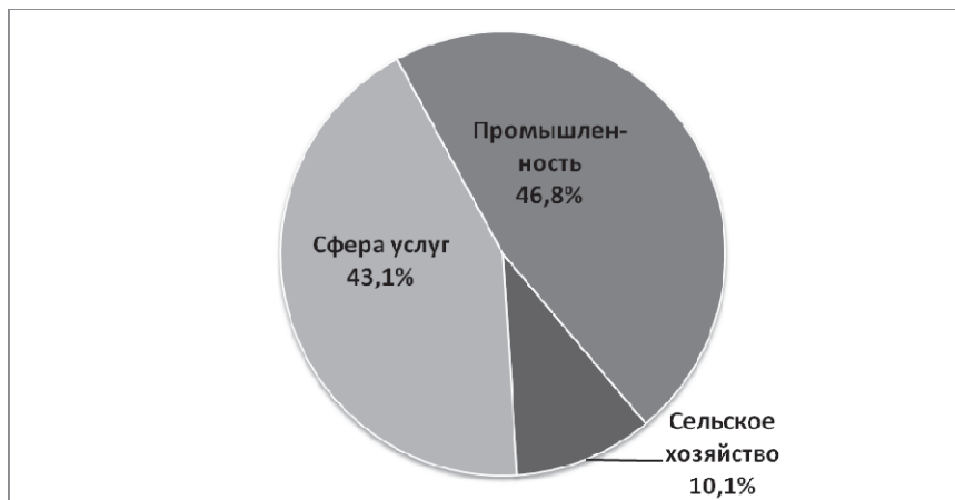
Рис. 2. Структура ВВП Китая в 2011 году [2]

Китай на сегодняшний день является индустриально-аграрной страной (рис. 2). Сельское хозяйство и связанные с ним отрасли имеют важнейшее значение в развитии народного хозяйства страны. Задача его полного развития и оптимизации является одной из наиболее актуальных.