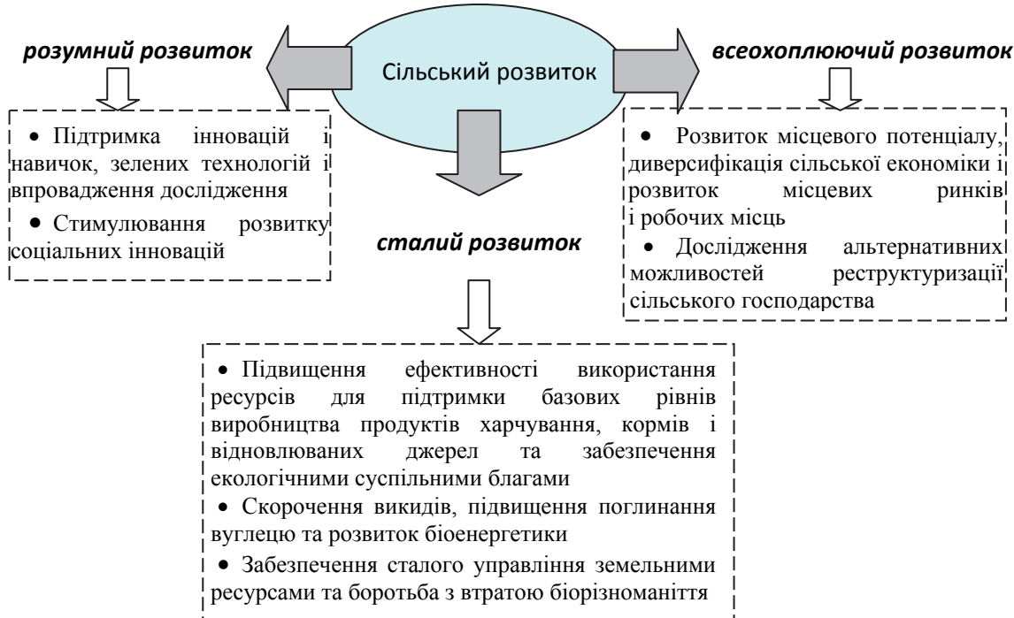
Рис.1. Сільський розвиток в контексті Стратегії “Європа 2020”

В рамках реформи САП у 2013 році Комісія пропонує, щоб Європейський аграрний фонд сільського розвитку (EAFRD) увійшов у нову спільну стратегічну конструкцію разом з Європейським фондом регіонального розвитку (ERDF), Європейським соціальним фондом (ESF), Фондом зближення і Європейським морським і рибним фондом (EMFF), для досягнення цілей (стійке, розумне і всеохоплююче зростання) Європейської стратегії 2020.