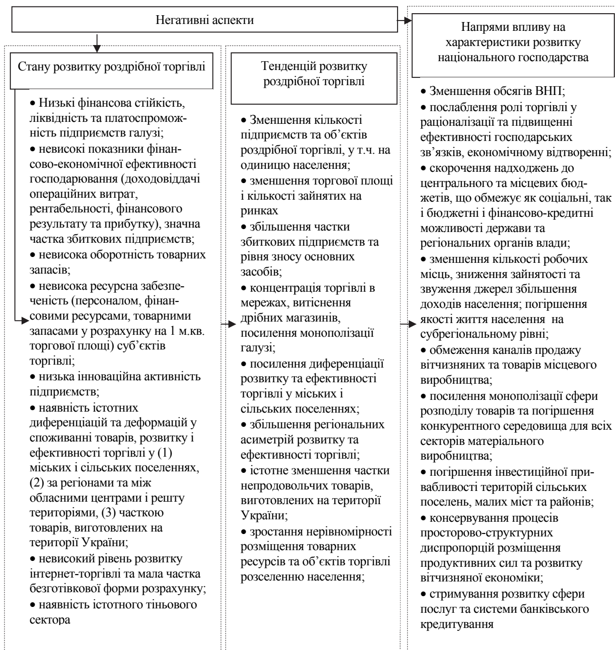
Рис. 2. Узагальнення негативних наслідків недостатньо ефективного регулювання роздрібної торгівлі в Україні та їх впливу на розвиток національного господарства (складено автором)

Зокрема, наявність негативних аспектів та тенденцій розвитку роздрібної торгівлі виступає чинником дестабілізації макроекономічної стабільності, фінансового сектора (а саме – бюджетного, грошово-кредитного, валютного, банківського сегментів), виробничого та інвестиційного середовища, негативно впливає на ефективність зовнішньої торгівлі держави, порушує багато соціальних, демографічних та продовольчих проблем.