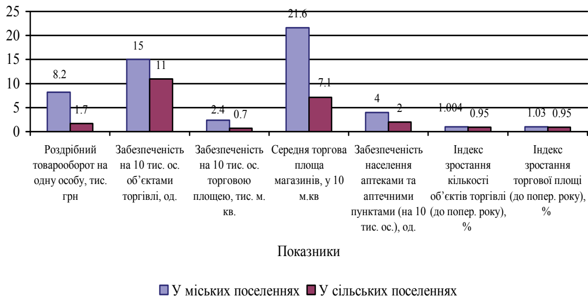
Рис. 1. Порівняння основних характеристик розвитку роздрібно торгівлі у міських та сільських поселеннях України у 2011 р. (складено за [2,с.9-19,131-166; 3,с.44-48,50-54,82-91])

(63 об'єкти) областями), роздрібних магазинів з чисельністю працюючих понад 100 ос. – 13,7 разів (між Дніпропетровською (41 об'єкт) та Тернопільською (3 об'єкти) областями).