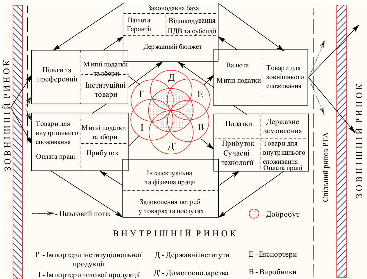
Рис. 2. Процес взаємного впливу економічних суб'єктів на національні інтереси

виконано. Результати показують, що угоди про вільну торгівлю, як правило, розширюють умови торгівлі більше ніж Митний Союз. Включення ендогенної лобістської діяльності виробниками може або посилювати або гальмувати розширення шляхом перекриття ЗВТ, хоча ця діяльність відносно експансії до нових країн-членів є менш ймовірною. На відміну від К. Фройнд, Х. Мукунокі вказують на те що, багатостороння вільна торгівля може бути реалізована, навіть якщо початкові тарифи досить низькі і більш низькі початкові тарифи можуть зробити експансію щодо перекриття ЗВТ більш ймовірною, коли уряди дуже занепокоєні політичними внесками [3, сс. 48-51].