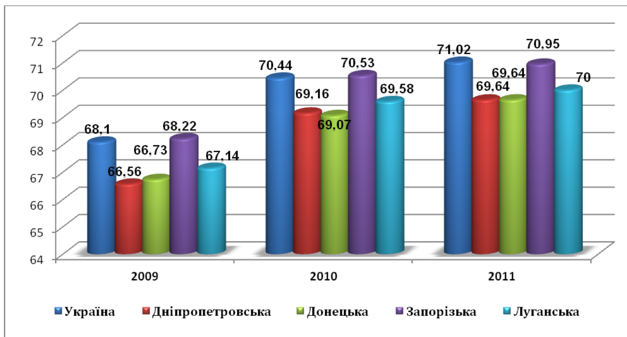
Рис. 2 Очікувана тривалість життя при народженні, років

Негативні процеси у демографічній сфері обумовлені низкою чинників: більш високим рівнем захворюваності населення, особливо на соціально-обумовлені хвороби; більш високою смертністю осіб працездатного віку, в першу чергу чоловіків; вищим рівнем виробничого травматизму; більш високим рівнем соціальних негараздів у даних регіонах (рівня злочинності, соціальних конфліктів тощо).