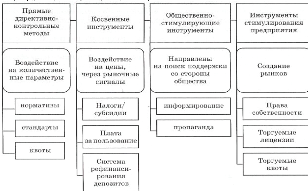
Рис. 1. Методы регулирования состояния окружающей среды

Современная экономика Украины до сих пор остается энергорасточительной: прямые потери ТЭР достигают 50%. Концентрация некоторых вредных веществ в воздухе в отдельных регионах страны