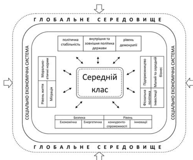
Рис. 1. Фактори впливу соціально-економічної системи та глобального середовища на формування середнього класу

Стає цілком зрозумілим, що всі ці процеси, зокрема внутрішнє середовища, формуються на основі соціально-економічної рівноваги державної політики, а зовнішнє – під впливом глобальних процесів. І хоча вони мають певний рівень організованості і впорядкованості, але в наслідок нестабільності зазначених факторів мають більш негативний характер впливу.