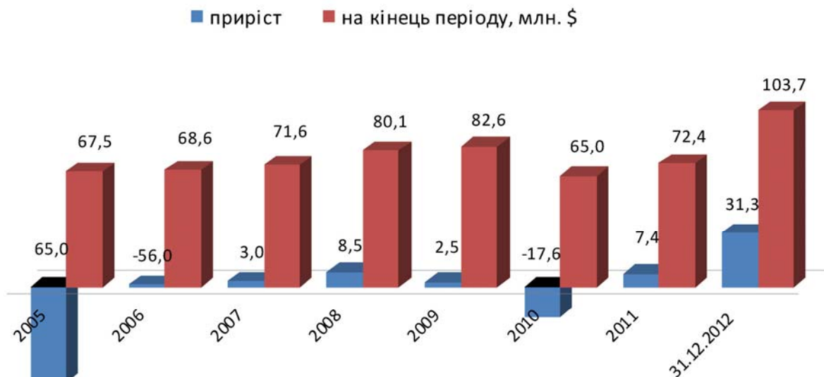
Рис. 1. Обсяг прямих іноземних інвестицій, млн. дол. США

Загальний обсяг прямих іноземних інвестицій, внесених з початку інвестування в економіку області станом на 31 грудня 2012 року (з урахуванням курсової різниці), становив 103,7 млн. дол. США та збільшився на 43,2 відсотка порівняно з початком 2012 року. У розрахунку на одну особу він склав 104,5 дол. США (рис. 1.).